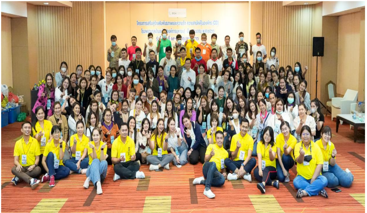
รุ่นที่ 5 ในวันที่ 19-20 มิถุนายน 2566