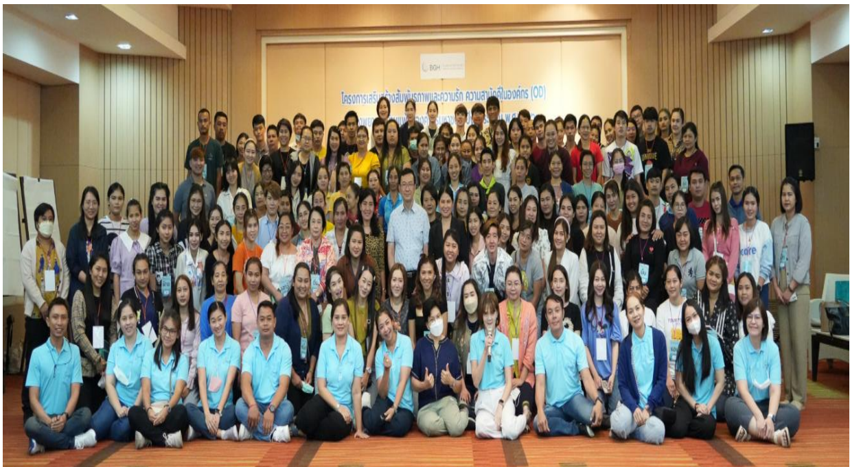
รุ่นที่ 2 ในวันที่ 20-21 เมษายน 2566