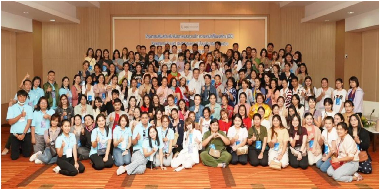
รุ่นที่ 1 ในวันที่ 2-3 มีนาคม 2566

กำหนดจัดอบรมจำนวน 8 รุ่น ดำเนินการเรียบร้อยแล้วจำนวน 5 รุ่น และอยู่ระหว่างดำเนินการ 3 รุ่น