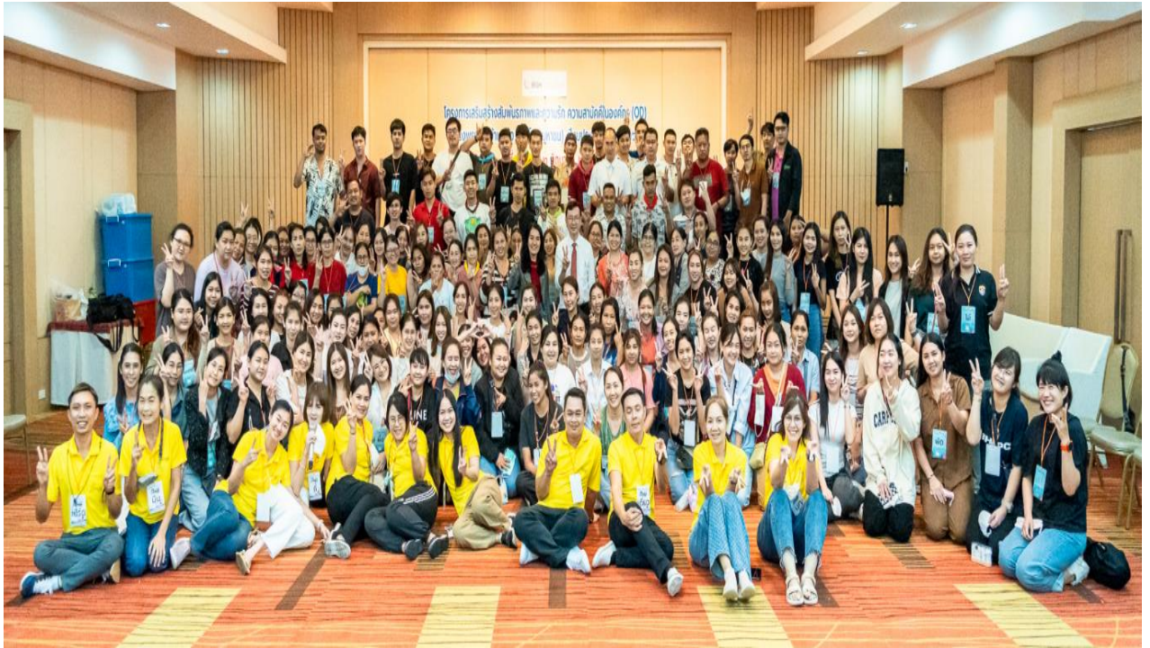
รุ่นที่ 4 ในวันที่ 1-2 มิถุนายน 2566