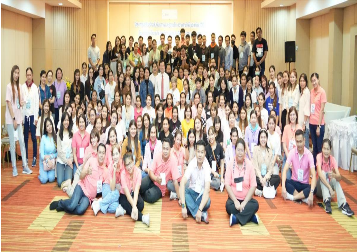
รุ่นที่ 3 ในวันที่ 18-19 พฤษภาคม 2566